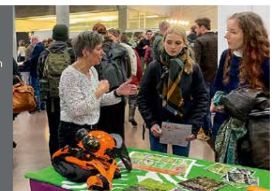
Impressie Carrièredag Leeuwarden