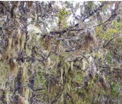
Baardmossen, indicator voor een goede luchtkwaliteit en oud bos