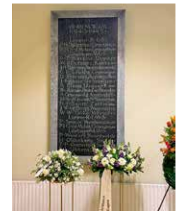
Op de gedenksteen staat de periode vermeld waarin ze op de school werkzaam zijn geweest.