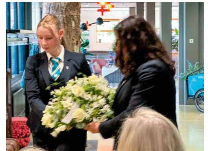
Bestuursleden van studentenvereniging Osiris van Hogeschool Van Hall Larenstein Leeuwarden leggen een krans voor de leraren en medewerkers die in de Tweede Wereldoorlog zijn omgekomen.

'Volgend jaar is het tachtig jaar geleden dat de oorlog werd beëindigd', zegt Blanksma. 'We willen dan graag speciale aandacht aan de herdenking besteden en hopen de alumni van VVA Aristaeus er meer bij te betrekken.'