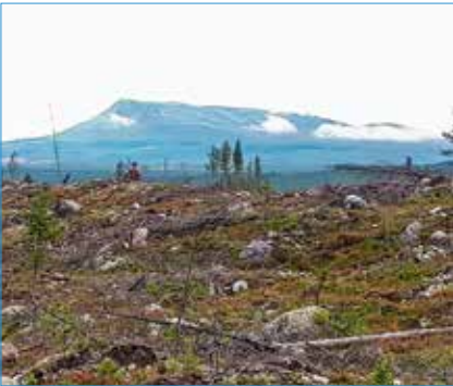
Geogst bos, kaalkap (avverking)