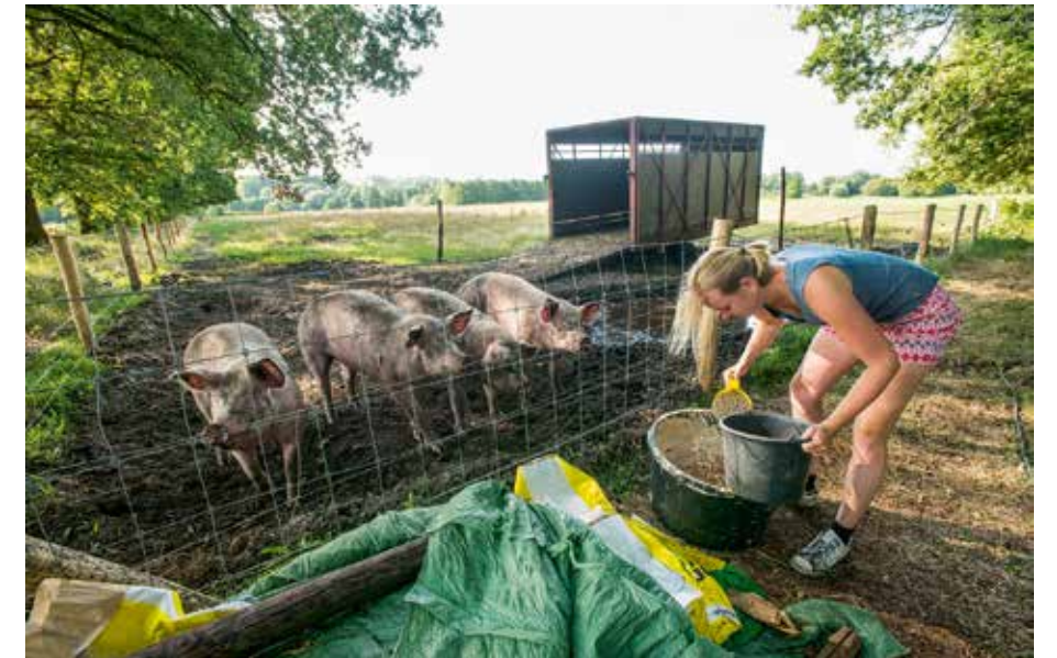
Varkens voeren op de Heerenboerderij in Loenen, een bijzondere vorm van natuurinclusieve landbouw bekostigd door burgers.